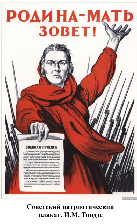
Советский патриотический плакат. И.М. Тондзе