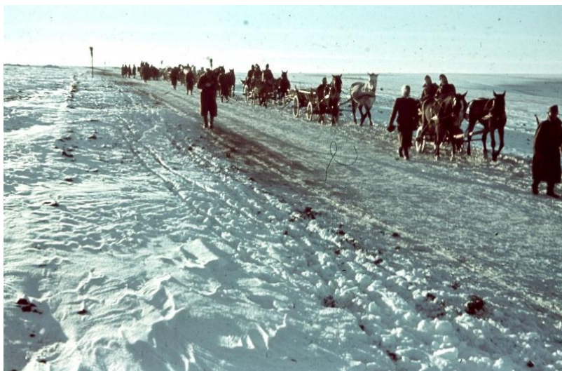
Подводы с отступающими венгерскими солдатами у села Ивановка Хохольского района Воронежской области

Разгром альпийского корпуса на воронежской земле явился финалом гибели 8-й итальянской армии ARMIR, начавшейся в ходе Сталинградской битвы. 3 сентября 1943 года Италия вышла из войны.