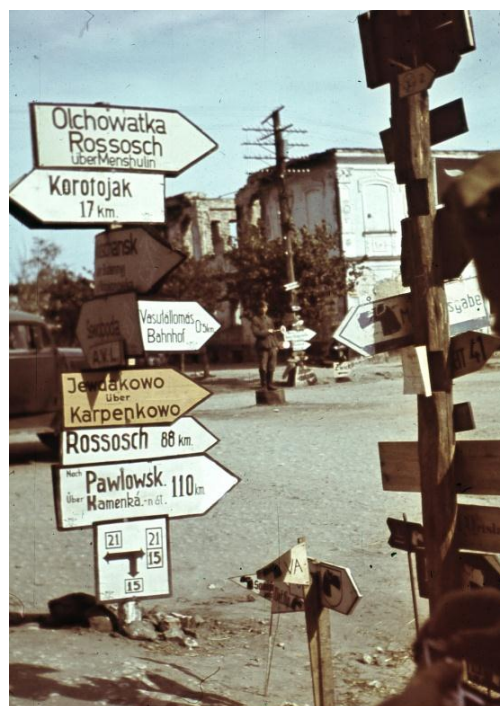
Немецкие дорожные указатели на перекрестке улиц К. Маркса и Медведовского (ныне Ленина) в оккупированном Острогжске Воронежской области.

Немецкое командование окончательно лишилось реки Дон как рубежа, который Гитлер требовал удерживать любой ценой. В то же время для советских войск были созданы благоприятные условия для развития наступления на Курск и Харьков, а также в обход Донбасса с севера. В ходе операции раз-