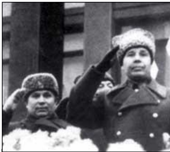
Маршал С.К. Тимошенко и член Военного Совета Юго-Западного фронта Н.С. Хрущев на трибуне у Воронежского обкома КПСС во время парада 7 ноября 1941 г.

В начале зимы 1941 года общая обстановка на советско-германском фронте изменилась. Красная Армия остановила продвижение врага на всем его протяжении, а на флангах развернула наступательные действия. Перейдя в решительное контрнаступление 5 декабря, наши войска разгромили противника под Москвой и закрепили свой успех, отодвинув линию фронта на запад. Однако к январю 1942 года советское зимнее наступление на южном фланге заглохло, линия фронта стабилизировалась в 140–160 километрах западнее Воронежа. Противники перешли к обороне, на фронте установилось